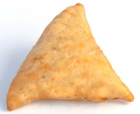
سموسة هندية ممشوة بالبطاطس